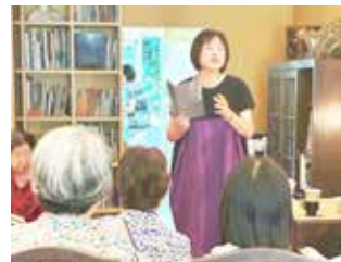
9 月 「朗読」 タイトル「愛情の裏側」 大人の朗読でした