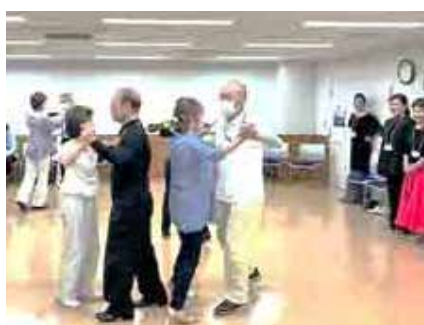
5 月 社交ダンスへのいざない 日本ダンススポーツ連盟 視覚に障害がある方も共に楽しみました