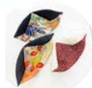
3 月 てしごと 布コースター

1 月 訪問美容とはどんなことをするのかのお話、実際の体験もできて、この後、space えんがわ inn で「お出かけ美容院」が始まりました