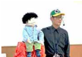
12 月 パントマイムと腹話術