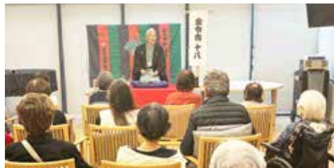
6 月 有料老人ホームチャームプレミアで 入居のみなさまと落語と手品を楽しみました