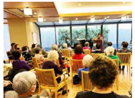
12 月 地域の有料老人ホーム チャームプレミアでのヴァイオリン・ピアノコンサート