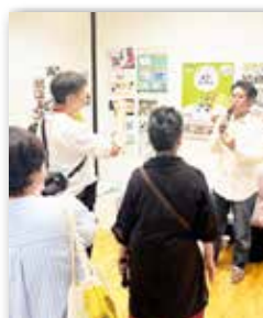
参加団体 それぞれの 発表時間