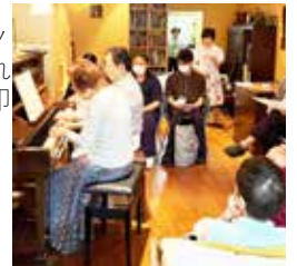
5 月 ピアノを楽しめる男性が印象的でした

1 月 訪問美容とはどんなことをするのかのお話、実際の体験もできて、この後、space えんがわ inn で「お出かけ美容院」が始まりました