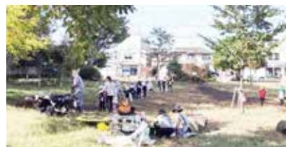
ねこじゃらし公園

ワークショップ形式でデザインされた公園として日本でも先駆けのねこじゃらし公園。遊具のない原っぱとして有名です。31年を経た今もグループねこじゃらしにより管理と清掃が続けられていますが、市民活動にはおさまりの「次世代にどう継続するか」がいよいよ課題です。