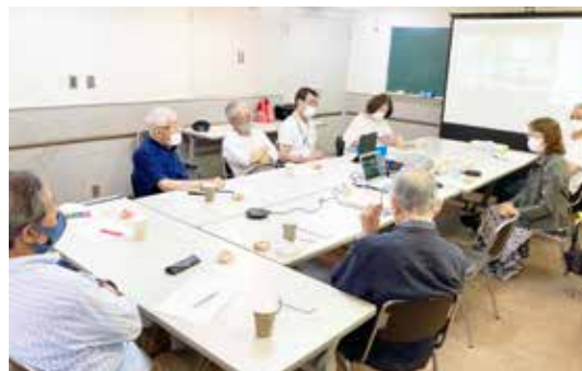
玉川田園調布会館で開催されています