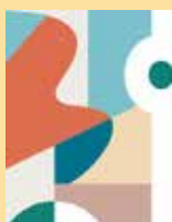
ほくりくみらい基金 Hokuriku Mirai Foundation

95 人の入場者、収入 19 万円から経費を除いた額 77,502 円を公益財団法人「ほくりくみらい基金」の令和 6 年度 9 月能登半島豪雨災害支援基金に寄付いたしました。