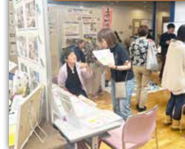
会場はあちこちにボードがたち迷路のよう