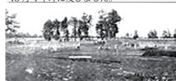
整地中の洗足分譲地

こうした壮大な計画の下で、土地の買収は直ちに実行に移されました。買収地域は大きく、洗足、大岡山、多摩川台の3地区で行われ、大地主の協力を得たこと等で、会社設立の僅か3年後の大正10年(1921年)11月までには買収を完了、買収総面積は計画面積を大きく上回る159万9000㎡、約48万4千坪に及びました。