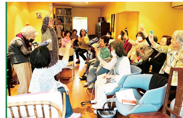
上の写真は第98回「朗読と本の教室」のみなさんによる「大人のための楽しいエッセイと小説と絵本の朗読の会」。身体を動かさず手あそびもあり、本当に楽しい時間でした。