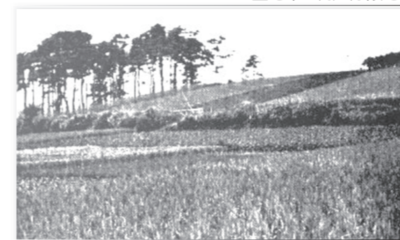
開発以前の田園調布付近

地区別の内訳を見ると、碑倉村・平塚村・馬込村にまたがる洗足地区は18万1500㎡、約5万5千坪、碑倉村・馬込村・池上村にまたがった大岡山地区は9万1千坪、そして、最も重点がおかれた調布村・玉川村にまたがる多摩川台地区(現・田園調布、玉川田園調布)では洗足地区の5倍を超える約100万㎡、約30万坪となっています。